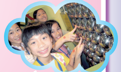
Are they strange?