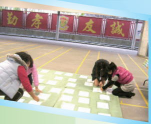
Parents came early to help set up and run the fun booths