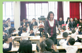
一丁班正在專心上課。

通過跟參加老師的積極研討和交流，這次活動對我們推行普教中的讀寫教學起了啟發和指導的作用。