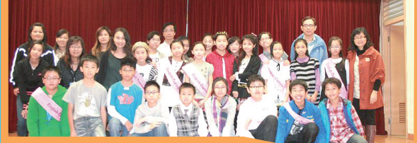
Teachers parents and student's worked together binging the day a big success.