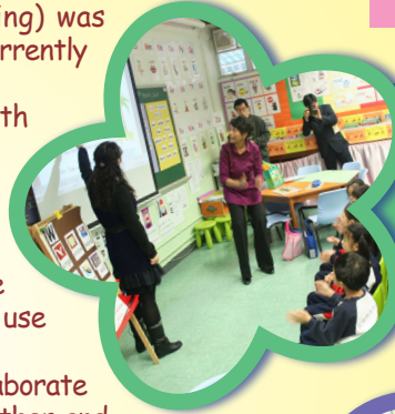
Focussing on position of the animals (Prepositions)