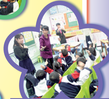
Revising the Alphabet Chant and Vocabulary