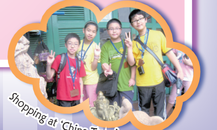
Shopping at 'China Town'