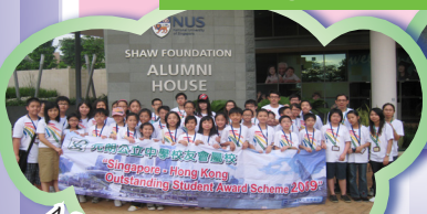
A 'Three School' photo at NUS