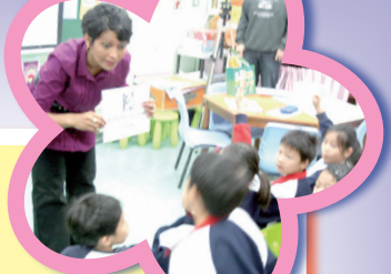
Sounding letter 'w'

We are grateful for having introduced the PLP-R/W Program at our school as we can see the overall benefits in our students' English learning.