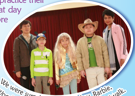
We were surprised to see Mickey, Barbie, Woody and Caesar showed up in the Catwalk.

Hallelujah Day was celebrated on 13th November 2009 to engage all our students in fun games and activities. The objective was for students to practice their English in an enjoyable way. The sudden cold weather on that day did not affect students' passion in joining the activities. More than 20 parents came early to help set up with the booths. There were different kinds of fun games for students, such as Jumping Game, Food Tasting (Sweet, Sour, Salty & Hot), Matching Game, Encouraging Sayings Dice Game and Tongue Twister Ball Game. Together with our Primary 6 English Captains, the parent helpers were all excited in helping to run the fun booths. They also enjoyed taking photos with students dressed up in costumes. Some students participated in a Catwalk depicting their favourite characters. This was really entertaining. This day was very successful as it was enjoyed by all.