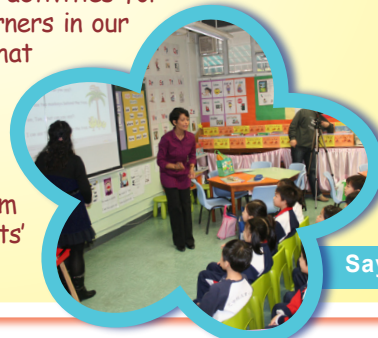
Saying the Chant together