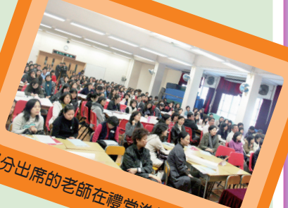
部分出席的老師在禮堂進行交流討論。