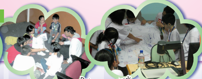
Doing group work