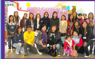
We really appreciate your help, dear parents!!