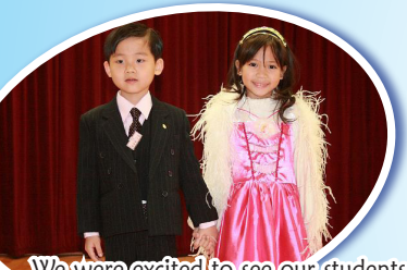
We were excited to see our students dressed up in beautiful costumes!