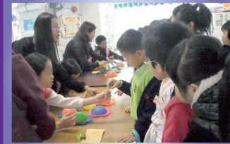
Students queued up for the games patiently.