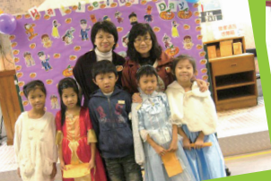
Teachers and parents enjoyed taking photos with students dressed up in costumes.