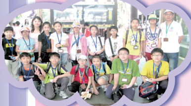
A family photo at the zoo.