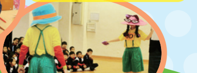
「平等世運會」一劇, 讓同學在歡笑聲中明白平等的重要。