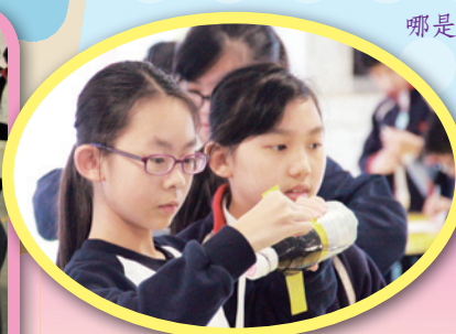
快完成了水火箭，可以進行測試。