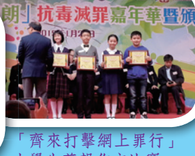
「齊來打擊網上罪行」 小學生剪報作文比賽