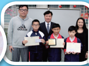
元朗小學校際跨學科 解難比賽