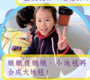
織織復織織, 小地毯再合成大地毯!