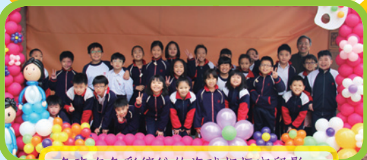
各班在色彩繽紛的汽球相框內留影。