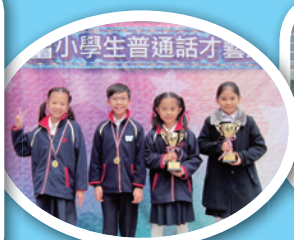
屯元區小學生普通話才藝比賽