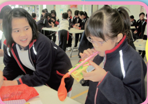
快點吹，看你的氣動賽車快還是我的快！