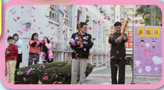
華服日在繽紛的花炮下揭幕