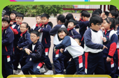
同學學跳 hip hop dance, 隨著節拍兩邊擺。

Hip-Hop 好勁啊! 芭蕾舞很優雅! 同時能觀看和玩樂在其中, 真的動靜皆宜。欣賞完舞蹈, 又要發揮「結伴成長」大姐姐的作用, 幫助一年級生做輕黏土, 大家合力製作一個作品, 成功感何其多啊!