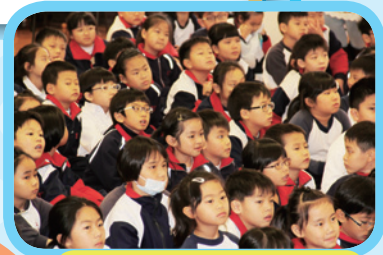
看! 同學們期待的樣子, 風琴快要奏出樂曲了。