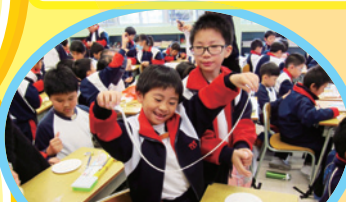
小五帶小一, 搓搓黏土, 樂趣滿分。