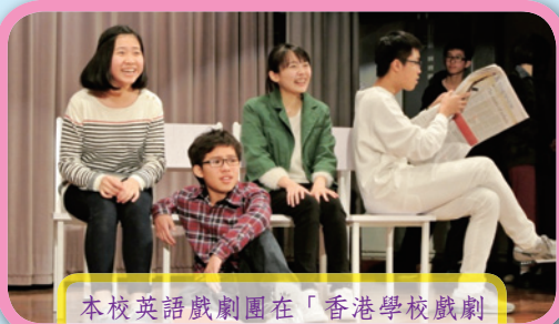
本校英語戲劇團在「香港學校戲劇節」囊括各個主要獎項

除了學術的成就外，鄧中亦重視學生的體育發展。在剛結束的元朗區學界羽毛球比賽，本校女子丙組奪團體優異獎；男子甲組奪團體亞軍，而男子乙組隊更經七回合奮戰後，勇奪團體冠軍。