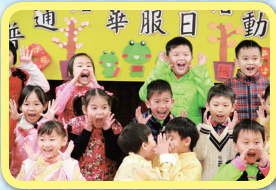
同學在普通話才藝表演中活潑興奮的演出