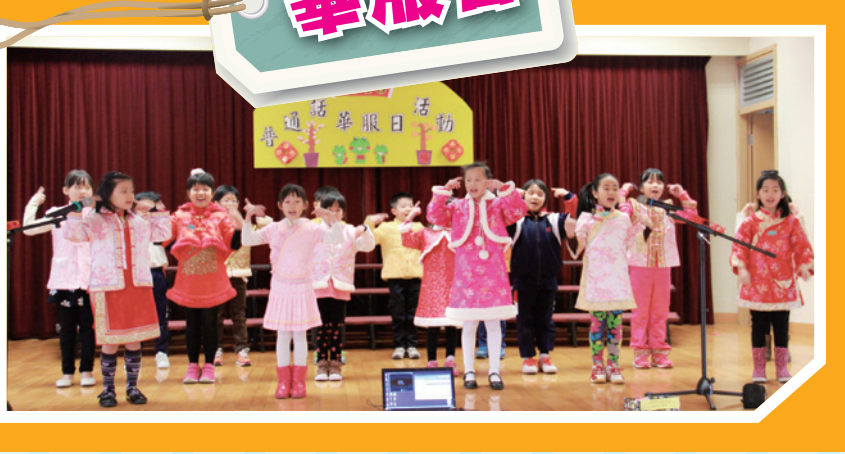
同學自信地運用普通話表演