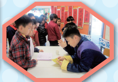
大家在操場上投入地玩各個攤位遊戲