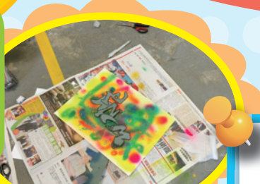
小六生用自己的名字進行塗鴉創作, 感覺新鮮。