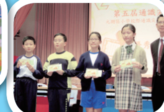
「通識尖尖尖」- 元朗區 小學校際通識尖子爭霸戰