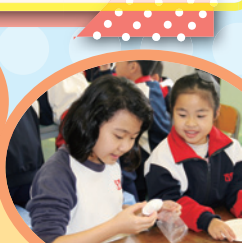
五年級同學的耐心指導, 小一生的作品當然漂亮!