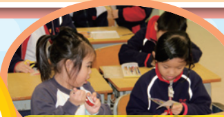
同學們聚精會神地修剪了自己的書籤, 力求盡善盡美。

學校舉辦這個藝術日, 令學生可以感受何為藝術及如何欣賞藝術, 雖然我們家長未能參與, 但小朋友回家後講述活動中的情況是非常興奮, 這表示學校舉辦得非常成功。