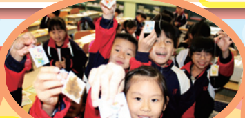
二年級同學製作的熱縮膠書籤誕生了!