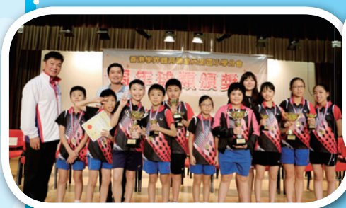
元朗區校際羽毛球比賽