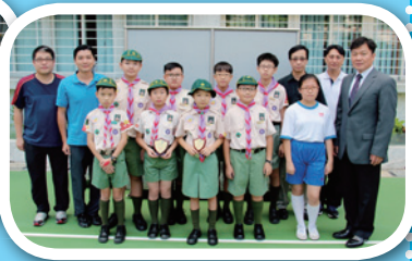
幼童軍主席盾比賽