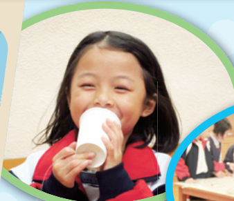
喂！喂！這是我的秘密，一起測試自製電話。

同學按指引進行預測，測試，從科學角度檢視及分析成效。各級同學對科學探索活動顯得十分雀躍及投入，大大培養同學的科學精神。