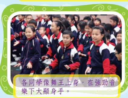
各同學像舞王上身, 在強勁音樂下大顯身手。

很欣賞學校舉辦藝術日, 令小朋友能在輕鬆愉快的氣氛下接觸不同類型的藝術元素及享受當中的樂趣。感謝老師及工友叔叔阿姨們的辛勤貢獻。