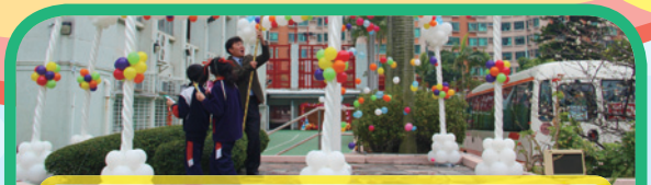
校長戳破汽球, 藝術日在歡呼聲中揭開序幕。