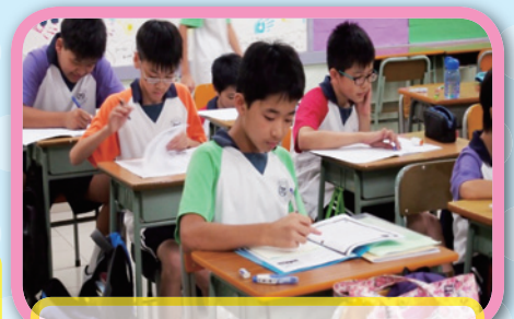
中一課後自主學習班的學員專注溫習