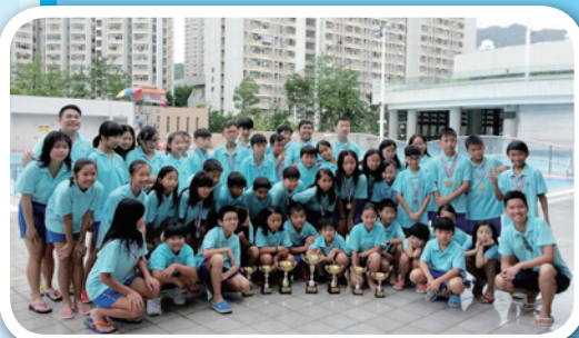
元朗區校際水運會