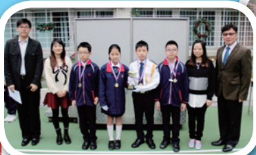
伯特利盃元朗區小學數學 多元挑戰賽