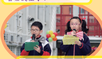
司儀生鬼對白, 博得全場大笑。