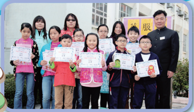
華服日花燈設計的優勝者